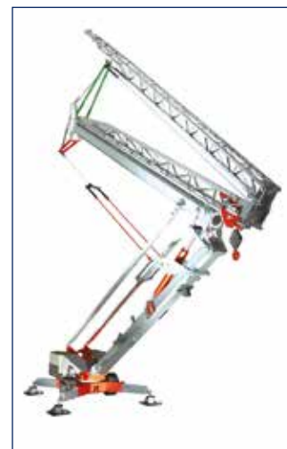
SURFACE AU SOL